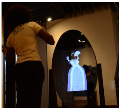
Figura 4: “Nossos Trajes”

Tais cortejos convidam aqueles que trabalham ou circulam pelo centro da cidade para conhecer (ou reencontrar) tradições, para seguir o séquito que percorre as ruas de modo a visitar o MGS e assim explorarem o universo simbólico das culturas populares com ajuda da tecnologia. Tal e qual a experiência oferecida pela instalação “Nossos Trajes” (Figura 4), na qual o público mira-se num espelho que os mostra paramentados, e em movimento, com indumentárias do folclore sergipano.