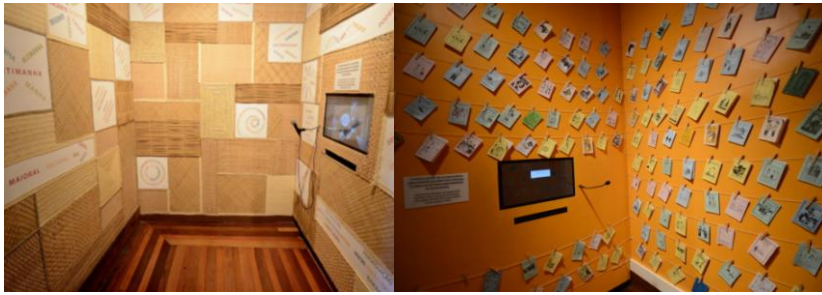
Figuras 2 e 3: Cabines das instalações “Seu Cordel” e “Seu Repente”, respectivamente. (Arquivo Instituto Banese)

As mostras organizadas na sala principal de exposições temporárias e no espaço expositivo do foyer valorizam o patrimônio cultural, mas não exclusivamente o edificado, o histórico, ou tradições e costumes. A homenagem a um personagem popular recentemente falecido, a exposição “Zé Peixe, além das águas”, foi composta por xilogravuras e estudos de imagem, tridimensionais e pictóricos, expostos em conjunto com poesia erudita e popular ( literatura de cordel ) sobre exímio nadador que conduzia embarcações para entrarem no Rio Sergipe alcançando-as em alto mar a nado e, do mesmo modo, voltava à terra firme quando as orientava em sua partida. Outras propostas curatoriais valorizam o patrimônio oficialmente reconhecido com combinações entre memórias afetivas, aspectos históricos e conteúdo audiovisual, como em “O Carrossel do Tobias”, exposição organizada para apresentar peças restauradas de brinquedo tombado como Patrimônio do Estado, outrora montado anualmente na Praça da Catedral Metropolitana de Aracaju durante os festejos natalinos. Uma alusão a este mesmo carrossel está presente em uma das instalações permanentes, aquela em que imagens de praças em diferentes municípios sergipanos são projetadas quando o visitante movimentava manualmente um carrossel, denominada “Nossas Praças”.